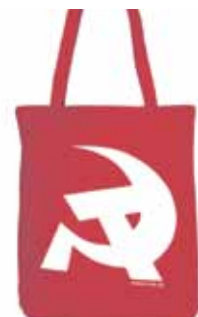
Baumwolltasche „Hammer & Sichel“

Kapuzenpullover Schwarz 2-farbiger Druck 80 % Baumwolle, fair gehandelt Größen XS bis 4XL 29,90 Euro