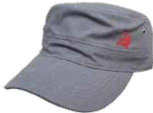
Cap „Hammer & Sichel“

T-Shirt Schwarz oder Weiß. 3-farbiger Druck Logo ca. 8 cm, Brusthöhe 100 % Bio-Baumwolle, fair gehandelt Größen XS bis 4XL 19,90 Euro