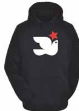
Hoodie „Friedenstaube / Stern“

Sommermütze kubanischer Art / Freizeit- und Arbeitskappe. Verschiedene Farben 1-farbiger Stick 100 % Baumwolle, Einheitliche Größe 14,90 Euro