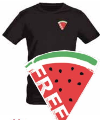
T-Shirt „Free Palestine!“

Alle Mitwirkenden des Friedensfestes und Aktualisierungen der Veranstaltungen gibt es hier: friedenstage.dkp.de