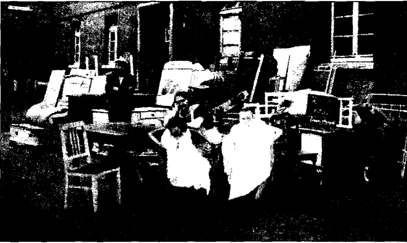
Foto: Wer die Arbeit verliert, verliert auch die Wohnung. Exmittierte Bergarbeiterfamilie 1931